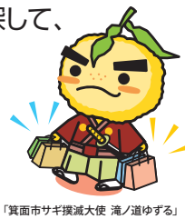
「箕面市サキ推進大使 滝ノ道ゆるる」