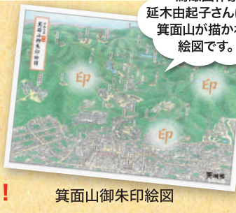
箕面山御朱印絵図