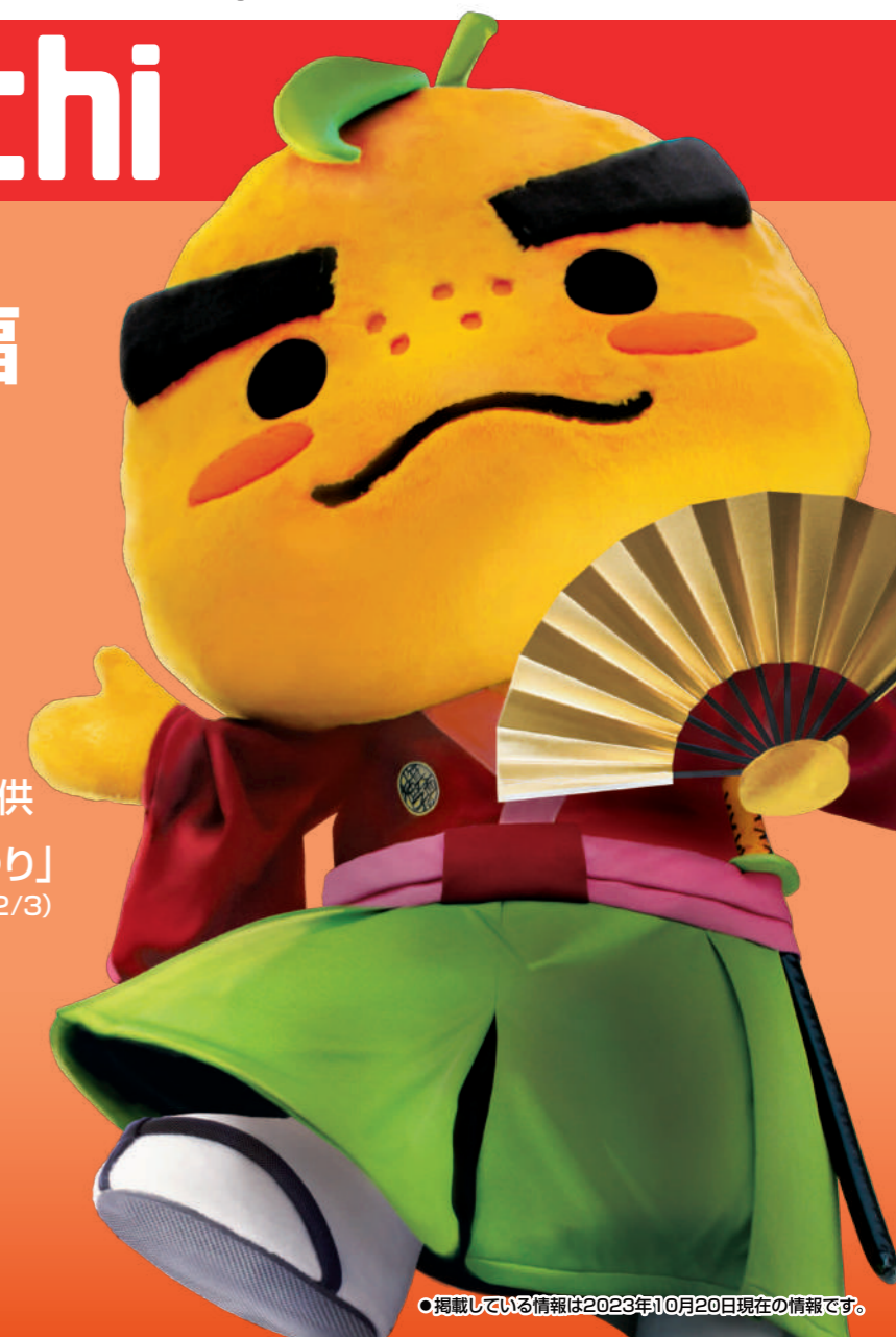
●掲載している情報は2023年10月20日現在の情報です。