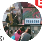
今年の箕面へは電車とバスで楽々知らず!

所 箕面駅前野外ステージ(みのおサンプラザ1号館 地下1階) 時 10:00~14:00(随時上映) 無料